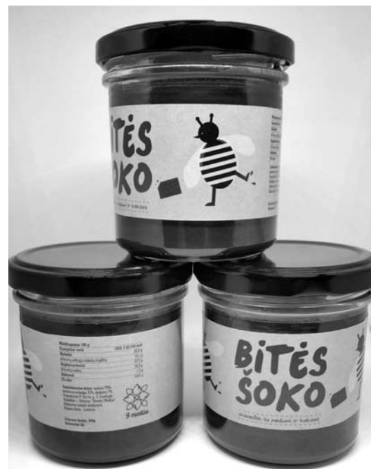
Medaus šokoladas – visiška naujovė Lietuvos rinkoje.