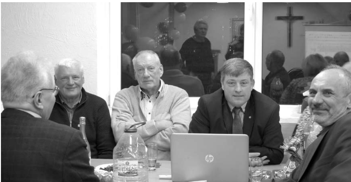
Socialdemokratas Dainius Žiogelis - būsimas Anykščių rajono vicemeras.