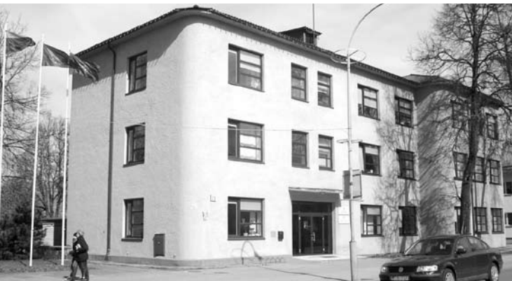
Anykščių rajono savivaldybė dalį sutaupyto lėšų socialinei paramai panaudos atlyginimams didinti ar mokėti.

Per 2018- uosius metus Anykščių rajono savivaldybė socialinei paramai nepanaudojo 49,3 tūkst. eurų. Vasarį posėdžiavusi nuėinanti Anykščių rajono taryba priėmė sprendimą, kokioms reikmėms bus išleistos nepanaudotos lėšos.