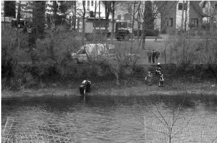
Moteris, atsidūrusi šaltame Šventosios vandenyje, savo planus pakeitė - ji pati bandė gelbėtis ir plaukė į krantą.

Penktadienio rytą ugniagesiai gelbėtojai Anykščiuose, Šventosios upėje, „žvejojo“ moterį. Nuo tilto nušokusią moterį srovė nunešė gerokai žemyn upe. Gelbėjimo operacijoje dalyvavo visų specialiųjų tarnybų atstovai, o ugniagesiai gelbėtojai išsiuntė net keturis ekipažus.