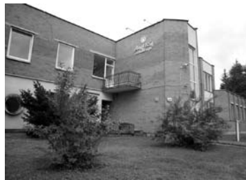
UAB „Anykščių vandenys“ privalės sumažinti kainas.

Patikrinimo metu nustatyta, kad dalis ilgalaikio UAB „Anykščių vandenys“ turto, tiesiogiai naudojamo reguliuojamojoje veikloje, nepagrįstai priskirtas nereguliuojamajai veiklai, todėl šio turto priežiūros ir eksploatacinės sąnaudos nepagrįstai priskir-